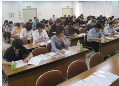
土曜日の半日を使い、検定試験を行った(株)クマクラ (埼玉県・新座市)建設廃棄物処理業 運送業

NPO認定講師が、問題を1問ずつ読み上げます。みんなで1問ずつ回答していきます。