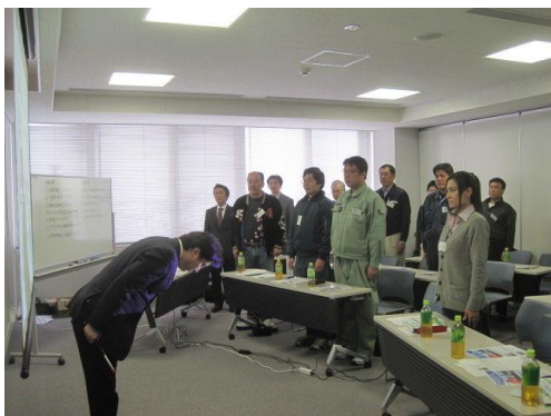
礼儀・挨拶の訓練。加須再生資源事業協同組合6社合同検定(埼玉県・加須市)