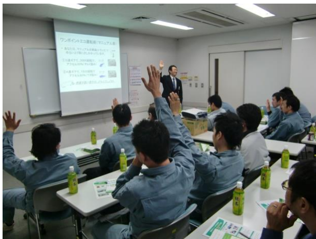
検定研修に積極的に参加する、オオマツ興業（埼玉県・吉川市） 建設系廃棄物処理業

～プロの廃棄物ドライバーとしての意識・動作・態度・運転理論などについて座学研修を行います。～