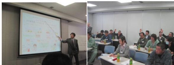
写真は実際の検定風景。埼玉県の加須再生資源事業協同組合員従事者の方と、加須市廃棄物行政職員がオブザーバー参加し、ECOドライブ安全認定3級&リサイクルマスター3級との合同検定試験を実施致しました。

NPOのやさしい講師が、問題を1問ずつ読み上げます。みんなで1問ずつ回答していきます。