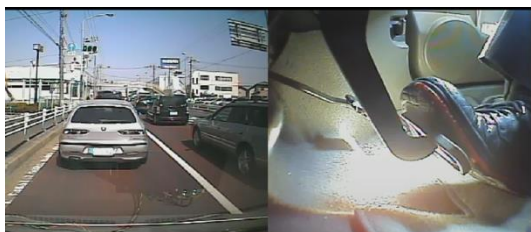
写真は実際の動画。繊細なアクセル操作。車間距離測定、エンブレキ、渋滞理論など、ECOドライブ安全運転の基本（初級）を学びます。

NPO認定講師が、あなたの会社に伺って、好きなお時間で集団研修・検定を行います。